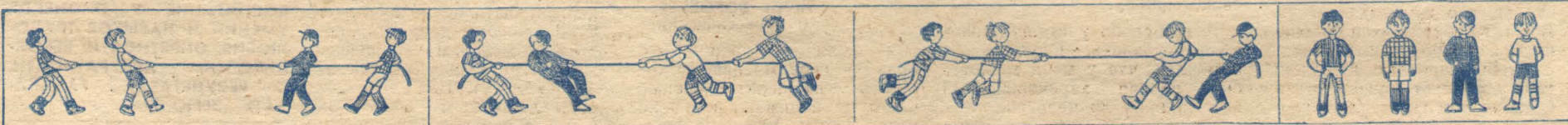
1. Равновесие сил.